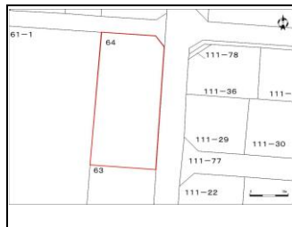
【京ヶ島・滝川地域】